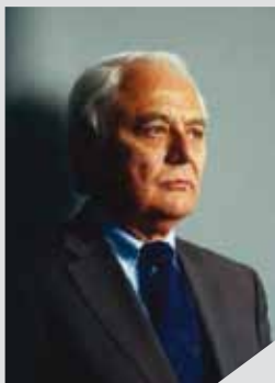
Αριστείδης Αντσακλής Πρόεδρος της Εθνικής Αρχής Ιατρικώς Υποβοηθούμενης Αναπαραγωγής Καθηγητής Γυναικολογίας ΕΚΠΑ